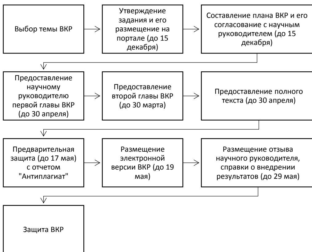
Рисунок 1 – График подготовки выпускных квалификационных работ